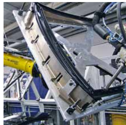
Verklebung eines Sichtteils aus Polycarbonat im Fahrzeug-Außenbereich bei Webasto

dung. Neben der trockenen Haftung wie beim Gecko ist die sekret vermittelte Haftung ein hochinteressantes Forschungsgebiet. „Die Sekrete sind in Puncto Polarität, Viskosität und Thixotropie speziell auf die jeweilige Haftaufgabe hin optimiert. Damit gelingt es der Natur, eine perfekte Balance zwischen Haftung und Lokomotion sprich Fortbewegung zu finden“, führte Julius Braun, Universität Tübingen, aus.