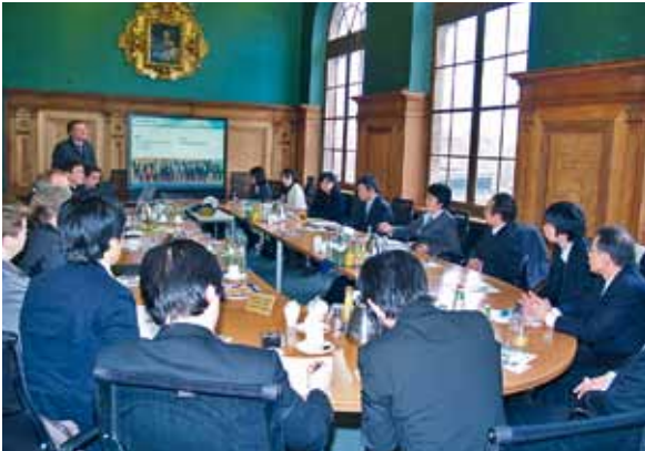
Japanische Delegation mit Vertretern der Stadtregierung Tokio sowie mittelständischen Unternehmen bei Bayern Innovativ

Innovationsnetzwerks in der Region Tokio, um kleine und mittelständische Firmen beim Zugang zu neuen Technologien zu unterstützen. Repräsentanten japanischer Unternehmen aus den Branchen Automotive, Energietechnik, Life Science und Mikroelektronik begleiteten die Mitglieder der Stadtregierung Tokio.