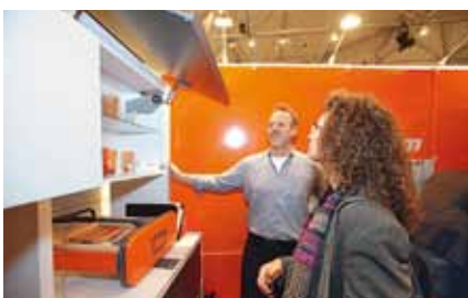
Klappensysteme mit hohem Bedienkomfort und neue elektrische Öffnungsunterstützung bei grifflosen Fronten

Das Forum führte über 300 Teilnehmer aus Bayern, dem gesamten Bundesgebiet sowie aus Österreich, der Schweiz, Italien und Tschechien in Rosenheim zusammen, darunter auch zahlreiche Studenten der Holztechnik.