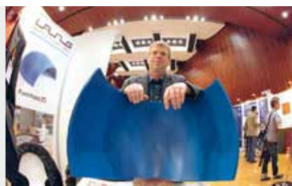
Neue Gestaltungsmöglichkeiten durch Formholz, zu sehen in der begleitenden Fachausstellung

institut Heinze GmbH, Celle, in seiner Trendstudie vor. Eingebunden waren rund 400 Architekten und Innenarchitekten. Megatrends sind städtisches und gesundes Wohnen, Sicherheit und