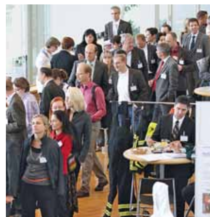
Großer Andrang in der begleitenden Fachaussstellung