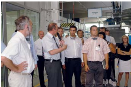
Führung durch die Fertigung von Polycarbonatdächern