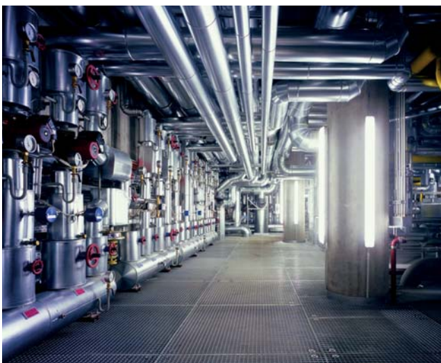
Versorgungstechnik bietet Einsparpotenziale

unterschiedlicher Unternehmen zu höheren Einsparungen führte als bei Einzelaktionen. Teilnehmende Betriebe konnten ihre Energieeffizienz im Vergleich zum Durchschnitt der deutschen Industrie um den Faktor 2 bis 3 steigern. Das Erfolgsgeheimnis der lernenden EnergieEffizienz-Netzwerke ist ein moderierter regelmäßiger Erfahrungsaustausch unter den Energieverantwortlichen der teilnehmenden Firmen sowie EDV-basierte Investitionsberechnungshilfen für die beratenden Ingenieure. Dadurch werden die Transaktionskosten der Betriebe erheblich gesenkt und zugleich die Leistungsfähigkeit und Produktivität der externen Beratung erhöht.