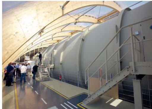
Membrankonstruktion für die Untersuchung von Feuchteschutz, Hygrothermik und Akustik