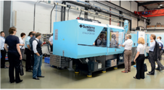
Besichtigung der Spritzgussmaschine