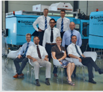
Referenten mit der Geschäftsführung der Sumitomo (SHI) Demag