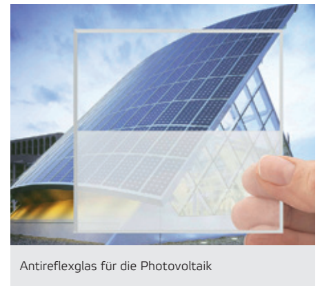
Antireflexglas für die Photovoltaik

Kernthemen des Cluster-Treffs „Oberflächenanalytik von Glas“, der am 19. Juli 2011 am Lehrstuhl für Werkstoffverarbeitung der Universität Bayreuth stattfand. Der Chemie Cluster Bayern und die Forschungsstelle WOPAG – Werkstoffe, Oberflächentechnologien und Prozesstechnik für Glas – organisierten diese Veranstaltung gemeinsam mit dem Cluster Neue Werkstoffe.